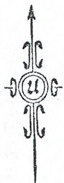
รูปแผนที่